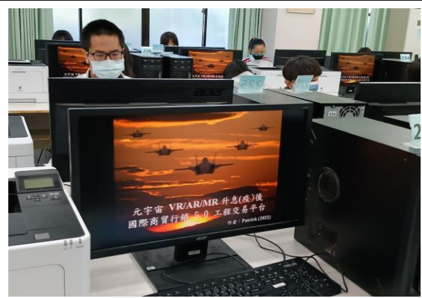
元宇宙與國際商貿行銷