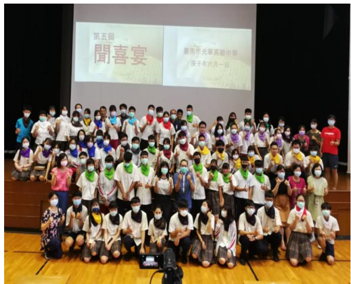
商經科各學士合照