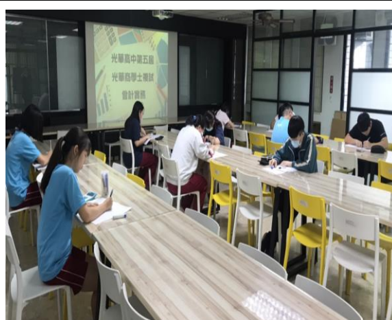
複試：競賽項目為會計記帳實務