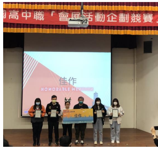
2021 第五屆全國高中職「會展活動企劃競賽」決賽