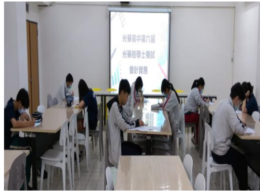
複試：競賽項目為會計記帳實務