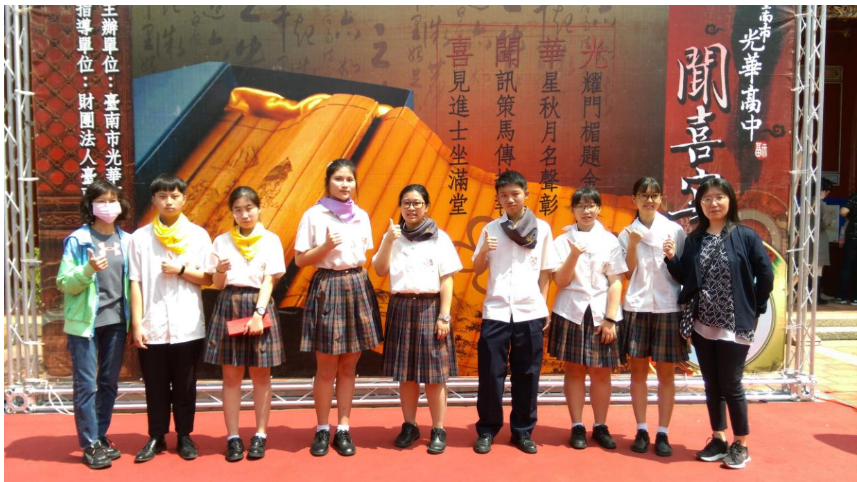
商經科各學士合照