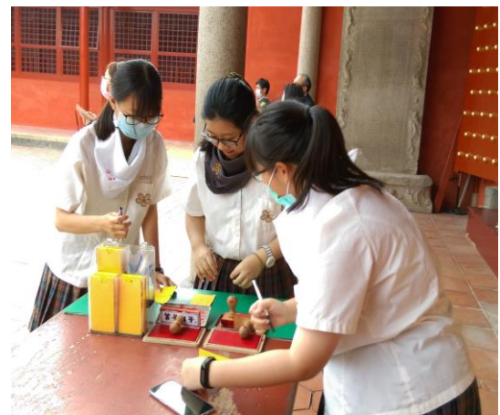
孔廟祈福-寫下心中願望