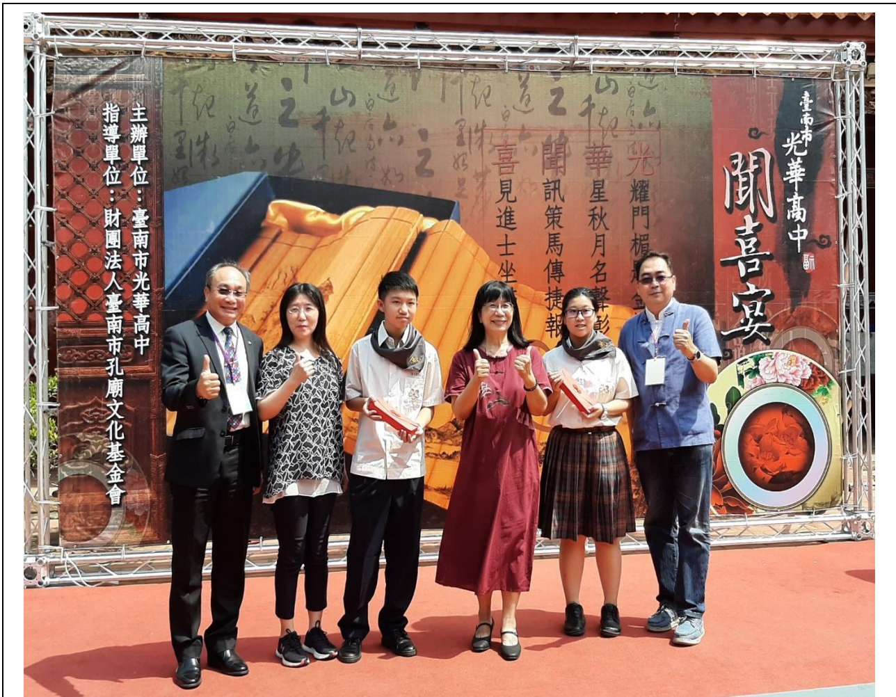
第 6 屆商學士合照