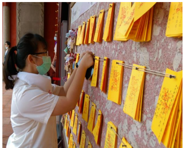
考生掛牌-祈求考試順利，金榜題名