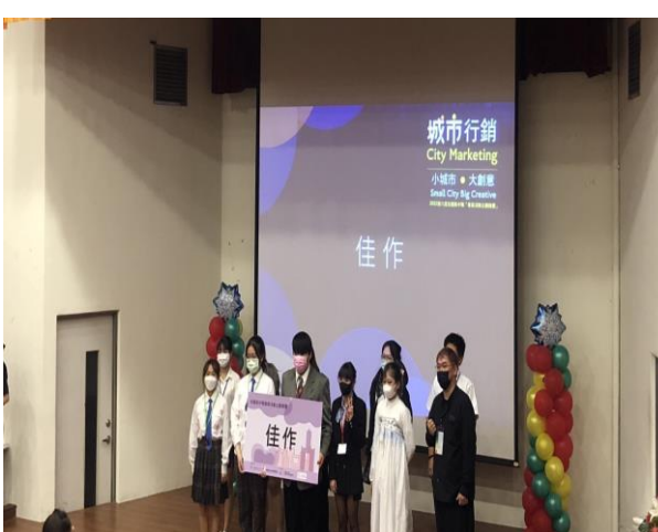
城市行銷組-一起旗車吧，佳作、會展活動創意獎