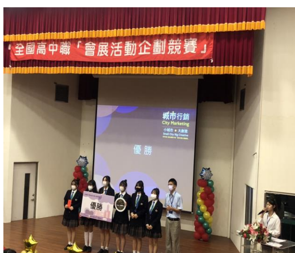
城市行銷組-花 YOUNG 遊高雄，優勝、會展活動創意獎