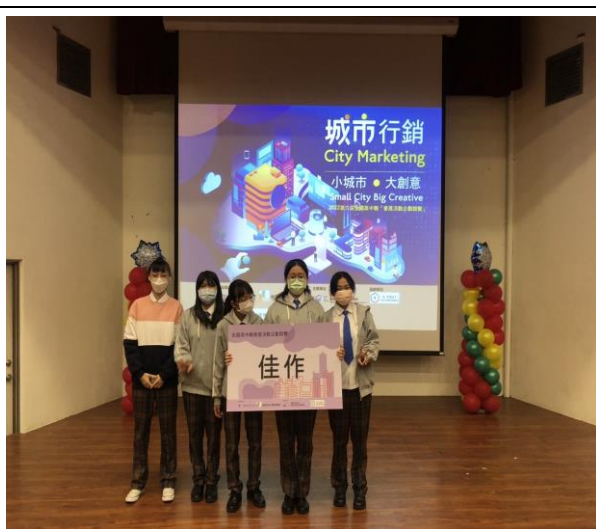
城市行銷組--古都熱腸，佳作、會展活動創意獎