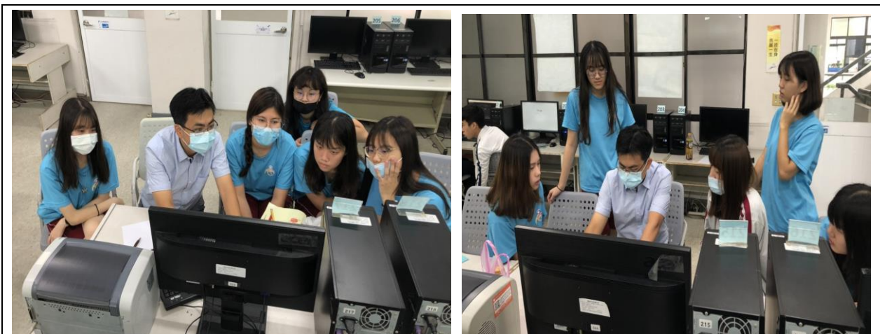
分組與教授討論主題的可行性